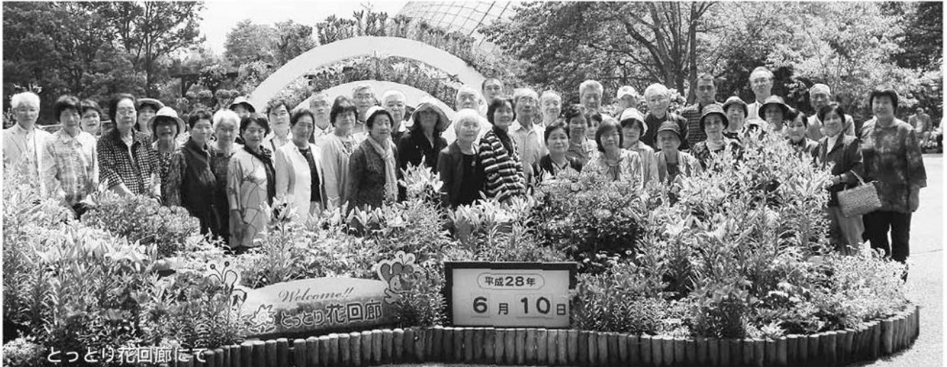
とっとり花回廊にて